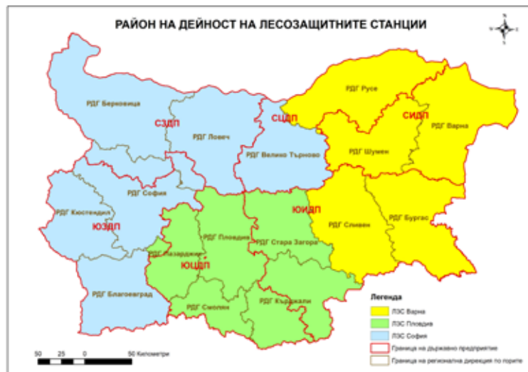
Фиг. 1 Район на дейност на трите лесозащитни станции

Условията на пандемията трите лесозащитни станции в София, Пловдив и Варна, както и всички лесовъди в страната, продължиха да извършват дейностите по защита на горските територии от болести, насекоми и други повреди, спазвайки противоепидемичните мерки, установени в Република България. Извършени са контролни проверки на близо 60 % от увредените през 2020 г. площи. Отчетени и анализирани са резултатите от заложените 415 лепливи пояса за мониторинг на педомерки, 512 фотоеклектора за листозавивачки, 536 феромонови уловки за борова процесия, гъботворка и корояди, 5139 проби от насекоми и увредени растителни части, както и резултатите от обследваните 331 стационарни обекта, в които се проследява развитието на стопански значимите насекоми и заболявания в горите на страната ни. Проверени и актуализирани са подадените през годината 15 208 сигнални листа и попълнените данни от 14 711 лесопатологични обследвания в актуализирания модул „Лесопатологично обследване“ в информационната система на ИАГ.