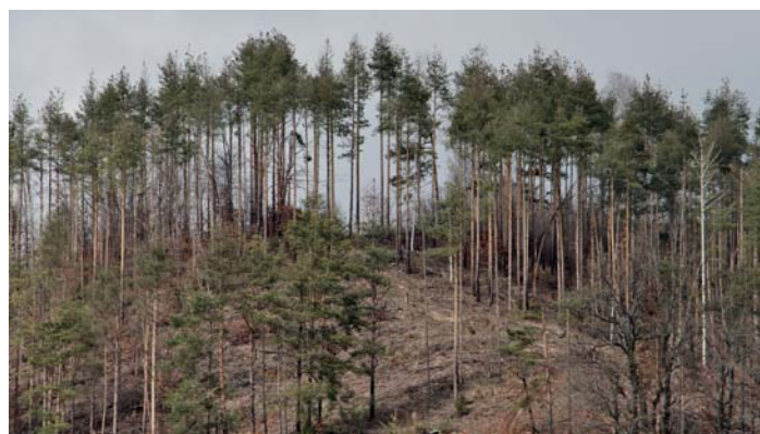
Един от обектите за усвояване на снежоломната маса в ГСУ - Ардино, от 190 дка, в който през 2015-2016 г. са добити 675 м 3 дървесина

От Кърджалийската част на Южноцентралното държавно предприятие - Смолян, в ДГС - Ардино, чийто релеф е изцяло високопланински, бедствието започва на 6 март 2015 г. с обилен студен дъжд, преминал в тежък мокър сняг и обледяване на короните на дърветата. Стихията вилнее до 11 март. Под тежестта на натрупалия се сняг иглолистните насаждения, около 50-годишни, в зоната между 400 и 800 м н.в., не издържат и започват да падат. Както ни казаха тук преди две години - с ефекта на домино. Горските са първи срещу стихията - разчистват пътищата от снега и нападалите дървета, откарват нуждаещите се до болницата. След това идва ред на инвентаризиране на пострадалата дървесина, която върху 3354 ха площ е общо 87 113 куб. метра. Ясно е, че маркираните за добив площи ще надхвърлят всички очаквания. През 2015 г. възложеният и изпълнен дърводобив е 29 403 м 3 , през 2016 г. при сечите (принудителни) са добити 42 619 м 3 , а се добавят и санитарните сечи - върху 813 дка с добив 15 509 м 3 , или общо досега е усвоен горският дървесен ресурс от 87 531 куб. метра. Населението през 2015 г. е събрало 2531 м 3 засегнатата дървесина, а през 2016 г., когато тарифната такса „на корен“ е намалена на 1 лв. за плътен кубик - 3165 куб. метра.