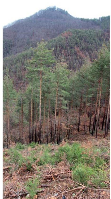
В обекта през м.г. е изведена санитарна сеч в короядното петно, в което се вижда укрепеният пограт от дуглазка и може да се разчита на естествено възобновяване