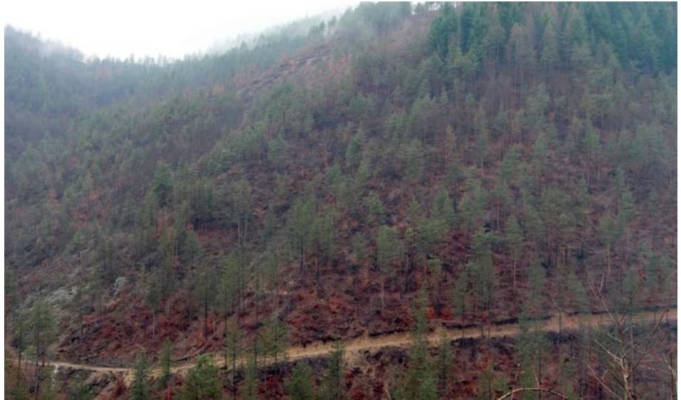
Прокарването на временни горски пътища спомогна за навременно усвояване на дървесината