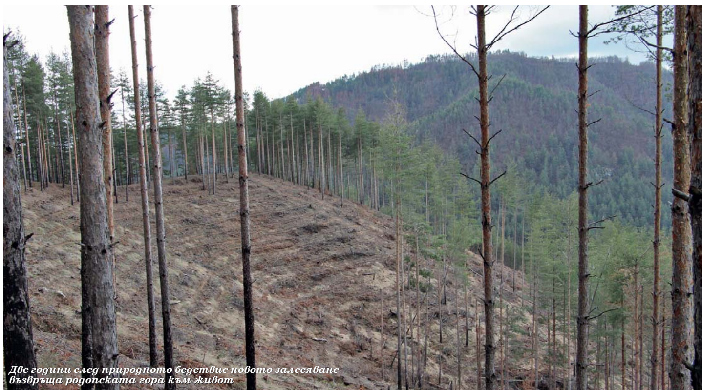
Две години след природното бедствие новото залесяване възвръща родопската гора към живот

Това е огромно постижение, но идва ред не на спокойствието, а на нови предизвикателства. Към края на 2016 г. вече е ясно, че в горите се развива процесът на съхнене, главна причина за който са короядите. Общата площ на засегнатите от тези вредители горски територии за ЮЦДП през 2016 г. е 4297.96 ха, а броят на короядните петна достига 6908. Дървесината, която попада в тези площи, е общо 367 457 м 3 (стояща маса). Естествено в тази „съхнеца зона“ първо попадат стопанствата със снеголомна и снеговална дървесина.