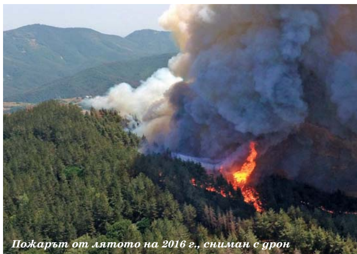
Пожарът от лятото на 2016 г., сниман с дрон

Инж. Войводов подчерта и добрата работата на фирмите, между които са „Универском“, „Смолес“, „Крисмастер“, с които са сключени договори за добив на дървесина в засегнатите от бедствието райони на територията на ДГС - Ардино, в което се уверихме на терена.