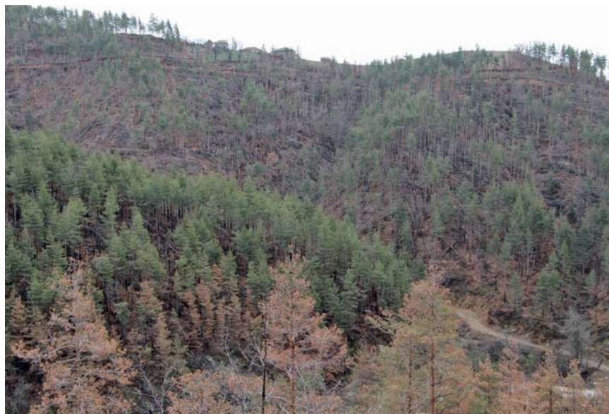
Типичен пример за неусвояване на пострадалата дървесина от частни имоти, намиращи се сред държавните горски територии

2005 г. в района на ГСУ - Мадан, има ветровал, но мащабът на пораженията му е несравним със сегашния. Разработените от ЮЦДП мероприятия за овладяване на последствията от природното бедствие от 2015 г. започват да се изпълняват без отлагане.