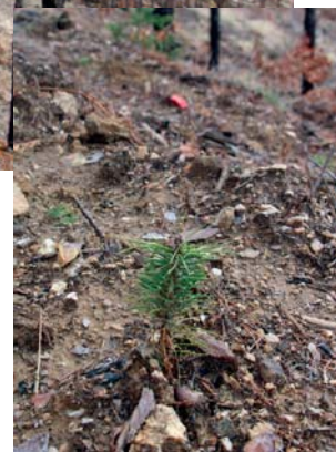
► Контейнерна фиданка

че стопанството от Смолянския регион с най-голям обем поражения от природното бедствие в системата на ЮЦДП най-геройски се справя с предизвикателството. Засегнатата от снеговала и снеголома площ през 2015 г. в ДГС - Златоград, е 3800 ха,