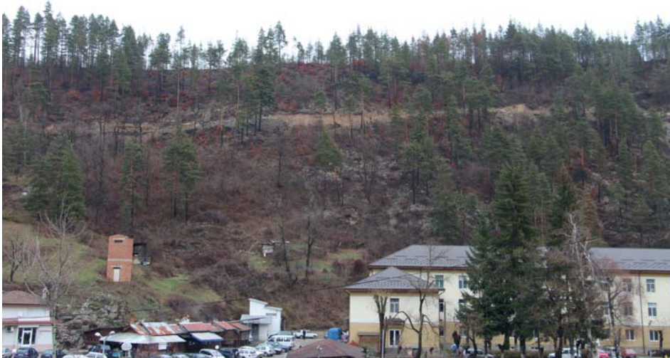
Изключително тежка картина представляваше повалената гора над гр. Мадан. Днес това е един от обектите в ГСУ - Мадан, в който раните от бедствието почти не личат

пострадалата дървесина - 203 000 куб. метра. В стопанството тъкмо приключва инвентаризацията за изработване на новия горскостопански план, но лесоустроителите остават, за да помогнат с невиданата до този момент инвентаризация на падналата маса. ДГС - Златоград, е изправено пред работа, която не им е съвсем непозната, тъй като през