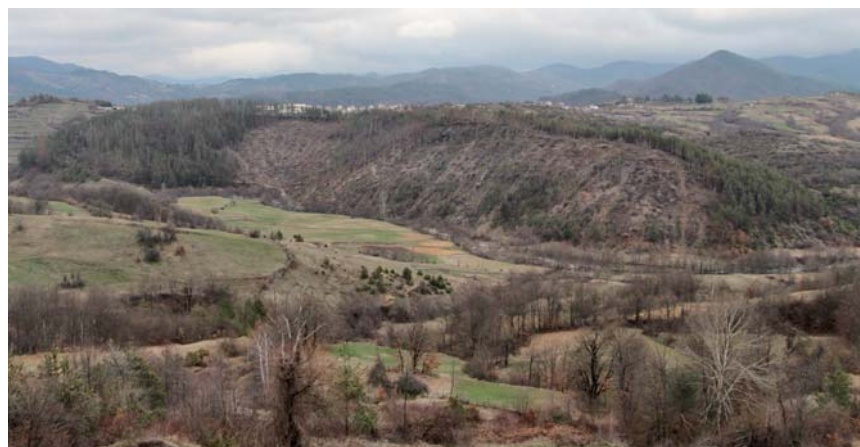
Добре изведена принудителна и санитарна сеч в два отдела с общо 295 дка засегнатата горска площ, от която са добити 1250 м 3 дървесина и са подготвени тераси за залесяване

На 29 юли 2016 г. поради човешка небрежност (деца на работници оставят незагасен огън) на територията на ДГС - Ардино, избухва пожар, обхванал 1450 дка, борбата с който продължава