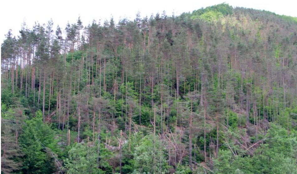
Землището на с. Войкова лъка, ГСУ - Рудозем