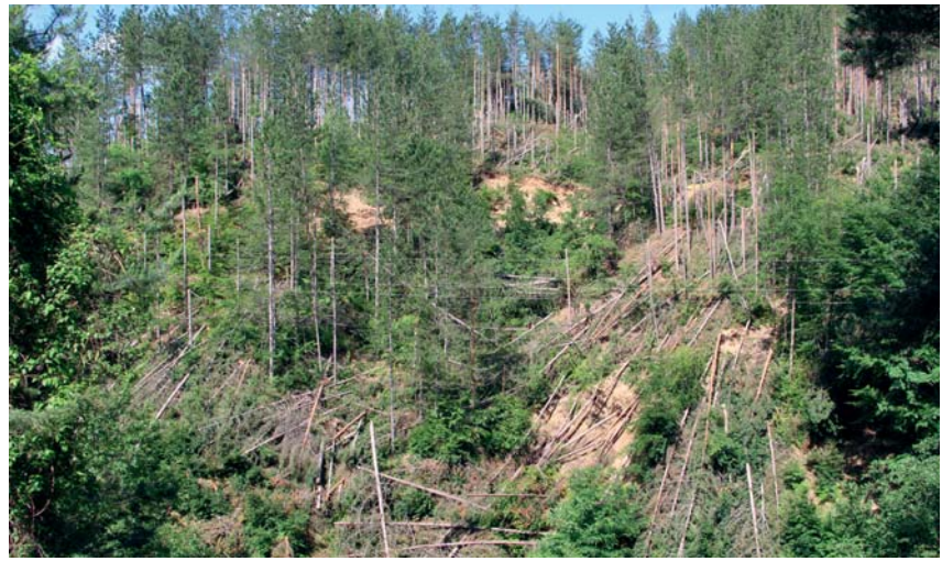
▲ Местността Сметицето, ГСУ - Неделино