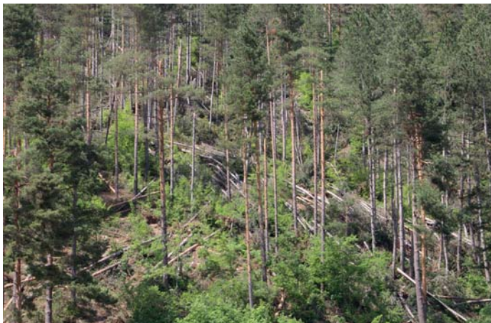
Районът над р. Арда, в м. Долен Рудозем, ГСУ - Рудозем, е почти недостъпен заради заобикалящите го земеделски имоти