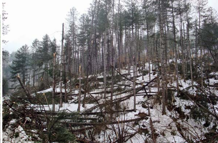
▲ Землището на с. Брезен, ГСУ - Боровица, през март