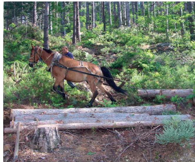
В м. Айвазови колиби, ГСУ - Неделино, усилено работят дърводобивни бригади

Лесосечният фонд за настоящата и следващата година ще бъде почти изцяло формиран от пострадалата дървесина - по 60 000 м 3 (при обикновено 32 000 м 3 ). Една трета от повредените насаждения по-