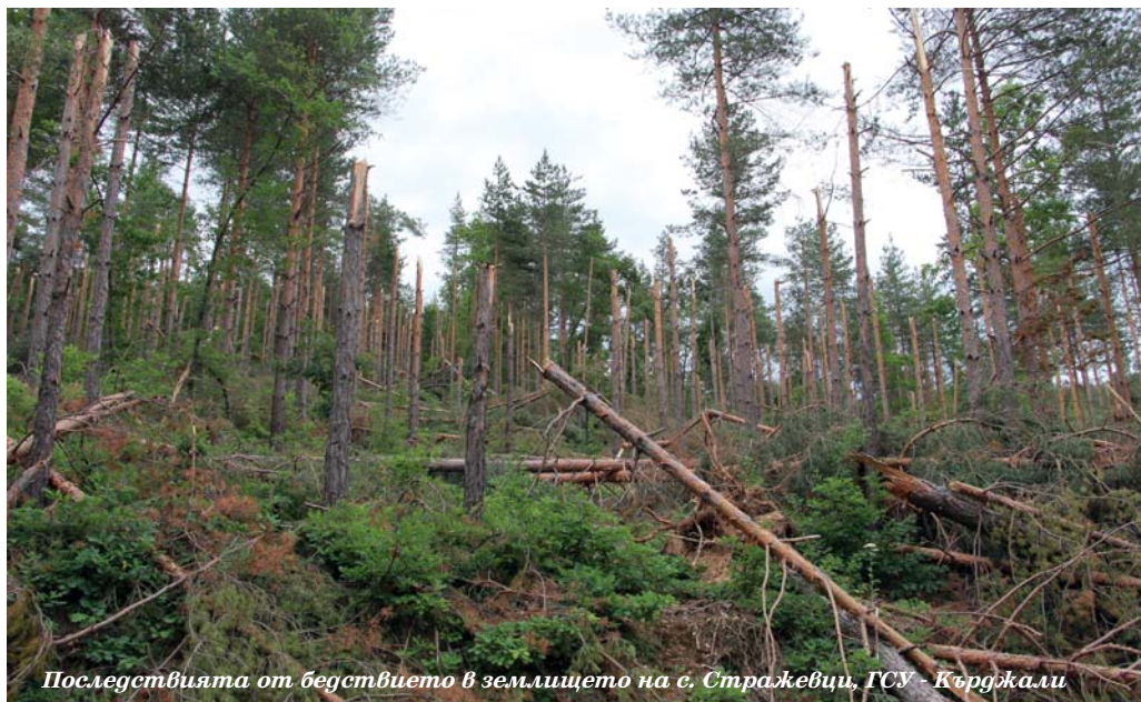
Последиците от бедствието в землището на с. Стражевци, ГСУ - Кърджали

Само широколистната растителност в смесените насаждения обгръща в успокояващо зелено и напомня, че природата ще превъзмогне и този катаклизъм. От стопанството смятат, че естественото възобновяване ще бъде добро и на отворилите се котли, повечето до 5 дка, няма да се наложи залесяване. Очакват изкуствените насаждения от бял и черен бор да бъдат заместени от местни широколистни видове.