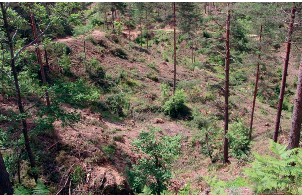
Вече почистен терен в м. Бял камък, ГСУ - Златоград