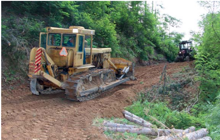
Ремонтът на горските пътища е изключително важен за усвояването на пагналата дървесина